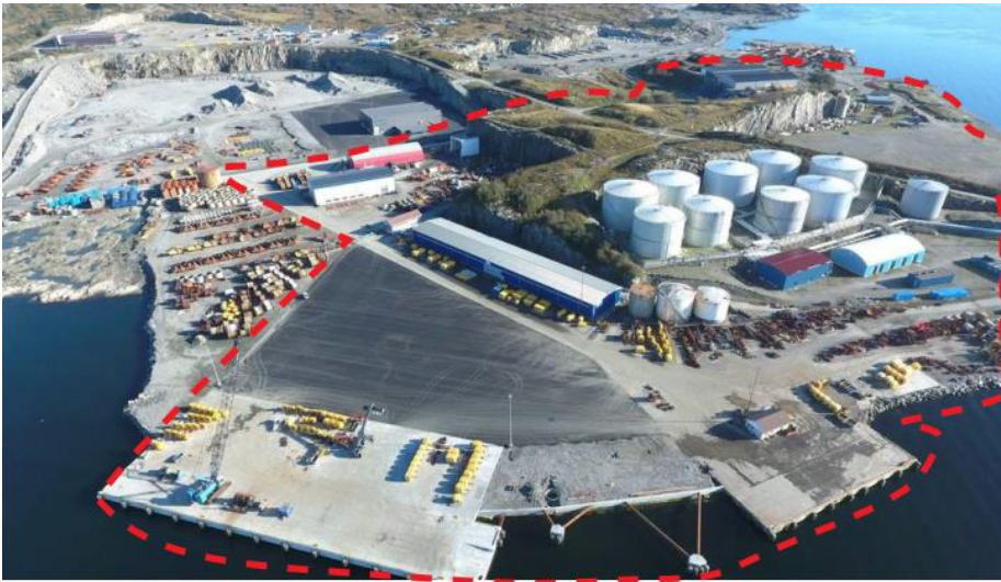
Illustrert grense av planen med eksisterande situasjon